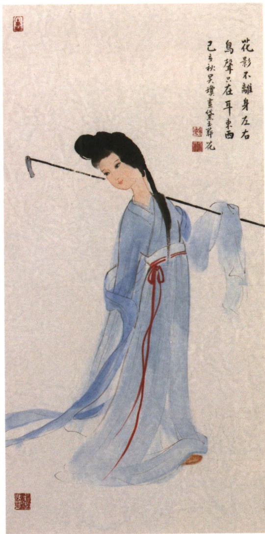
黛玉葬花 中国艺术研究院博士吴琼/绘