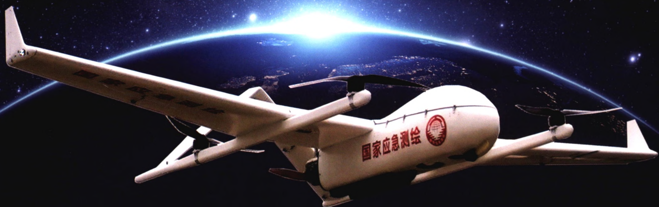
垂直起降 CW-100 载荷 \leq 20\text{kg} 续航 > 4 小时