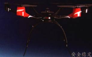
安全稳定 KWT-X6L 载荷 \leq 5\text{kg} 续航 \leq 60 分钟

河南省遥感测绘院是国家应急测绘保障能力建设河南省级节点承建单位，拥有CW-100复合翼、KWT-X6L多旋翼等大、中、小型无人机20余台，具备实时图像传输、热红外跟踪、应急航空摄影等快速响应能力，形成覆盖“事前预防、事中处置、事后恢复”全流程的无人机应急测绘服务保障体系，能够为地灾防治、森林防火、秸秆禁烧、安防布控、矿产执法、违建监测等工作提供定制化测绘服务。