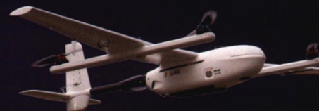
单兵作业 CW-007 载荷 \leq 0.8\text{kg} 续航 \leq 1 小时