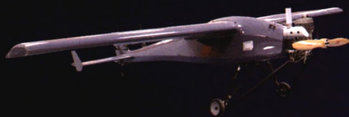
滑跑起降 DM-150 载荷 \leq 4\text{kg} 续航 > 3 小时