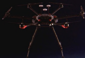
模块化拆装 M600 Pro 载荷 \leq 6\text{kg} 续航 \leq 35 分钟