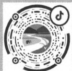
“湖南农业杂志社” 抖音号