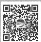
“潇湘三农” 微信公众号

采编部电话 (0731)84434029 投稿邮箱 www.hnnyzz.com hnnbjb@163.com 发行财务科电话 (0731)84431381、84426257 发行财务科邮箱 hnnyfxk@163.com 地址 长沙市岳麓区枫林一路9号 邮政编码 410006 发行方式 国内外公开发行 发行单位 全国各地邮政局(所) 湖南农业杂志社发行科 广告经营许可证 4301004000001 印刷单位 湖南凌宇纸品有限公司