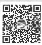
“潇湘三农” 微信公众号

采编部电话 0731-84434029 投稿网址 www.hnnyzz.com 投稿邮箱 hnnybjb@163.com 发行财务科电话 0731-84431381、0731-84426257 发行财务科邮箱 hnnyfxxk@163.com 地址 长沙市岳麓区枫林一路9号 邮政编码 410006 发行方式 国内外公开发行 发行单位 全国各地邮政局(所) 湖南农业杂志社发行科 广告经营许可证 4301004000001 印刷单位 湖南凌宇纸品有限公司