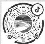
“湖南农业杂志社” 抖音号