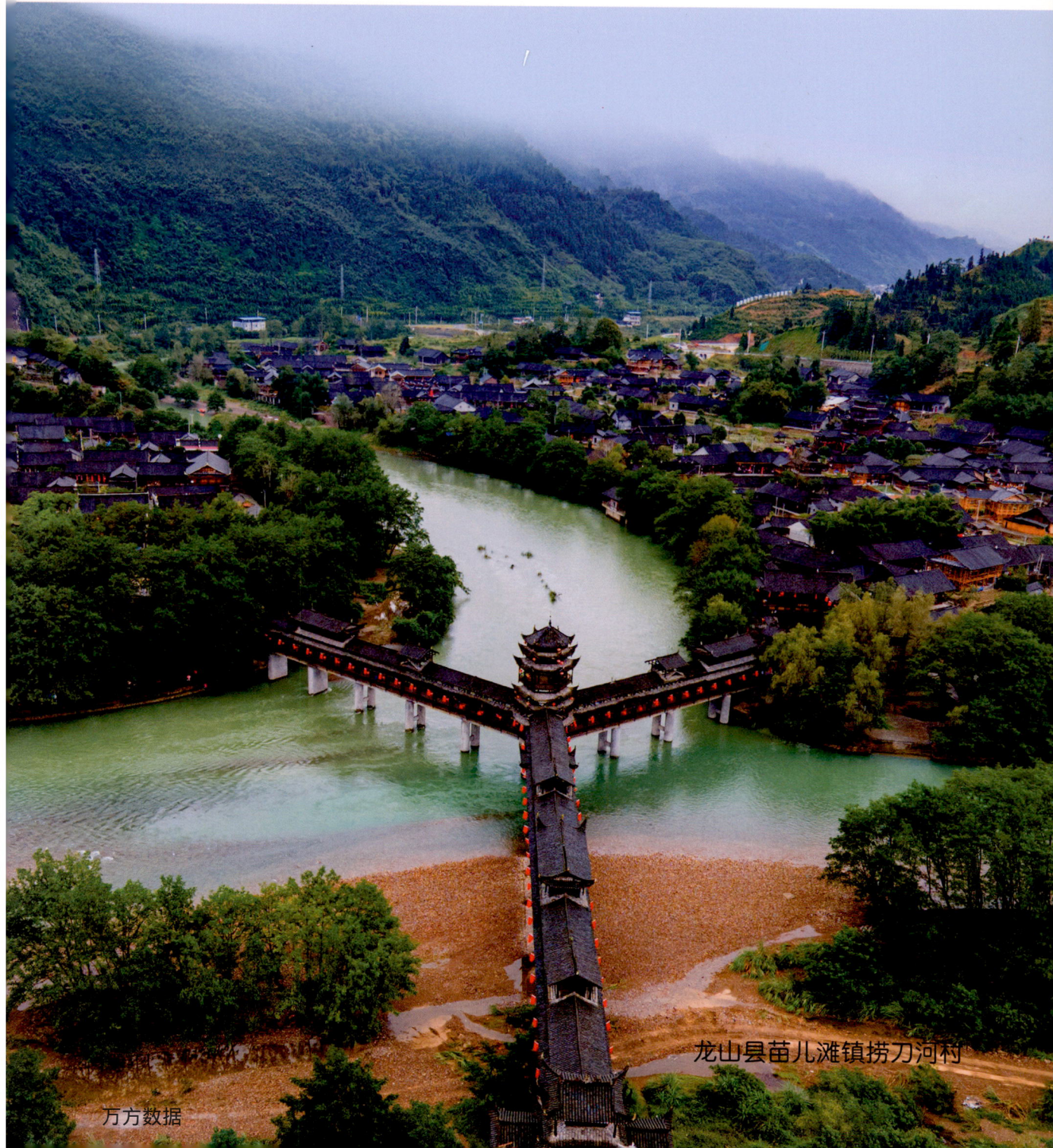
龙山县苗儿滩镇捞刀河村