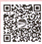
“潇湘三农” 微信公众号

网 址 www.hnnyzz.com 采编部电话 0731-84434029 财务电话 0731-84426257、84431381 投稿邮箱 hnnybjb@163.com 发行邮箱 hnnyfzk@163.com 地 址 长沙市岳麓区枫林一路9号 邮 政 编 码 410006 发 行 方 式 国内外公开发行 发 行 单 位 全国各地邮政局(所) 湖南农业杂志社有限责任公司 广告经营许可证 4301004000001 印 刷 单 位 湖南凌宇纸品有限公司