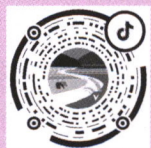
“湖南农业杂志社” 抖音号