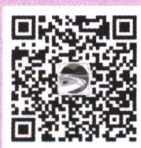
“湖南三农” 微信公众号

网 址 www.hnnyzz.com 采编部电话 0731-84434029 财务电话 0731-84426257、84431381 投稿邮箱 hnnybjb@163.com 发行邮箱 hnnyfxk@163.com 地 址 长沙市岳麓区枫林一路9号 邮政编码 410006 发行方式 国内外公开发行 发行单位 全国各地邮政局(所) 湖南农业杂志社有限责任公司 广告经营许可证 4301004000001 印刷单位 湖南凌宇纸品有限公司