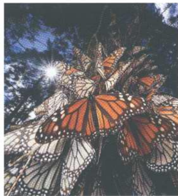
全球动物大迁徙 — 92