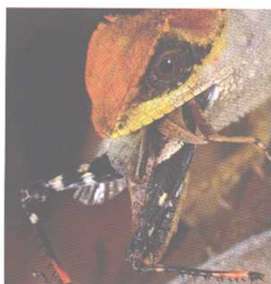
海南霸王岭 — 132