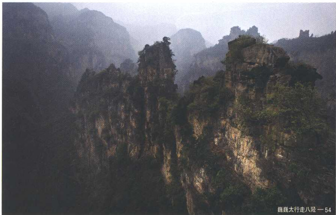
巍巍太行走八陁 — 54