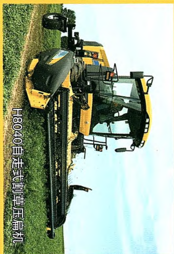
H8020自走式割草压扁机