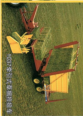
1037牵引式草捆捡拾车

牧草机械是纽荷兰的核心产品之一，世界上第一台捡拾打捆机就来自于纽荷兰。在世界各地畜牧业发达地区，纽荷兰牧草设备都得到广泛应用。纽荷兰可以提供牧草收获全程机械化设备，包括牵引式割草压扁机、自走式割草压扁机、搂草机、翻晒机、小方捆打捆机、大方捆打捆机、圆捆打捆机和草捆捡拾车等。 富于创新精神的纽荷兰，将以设计先进、工艺精湛的全套牧草产品，满足当前国内市场对牧草收获更多的需求。