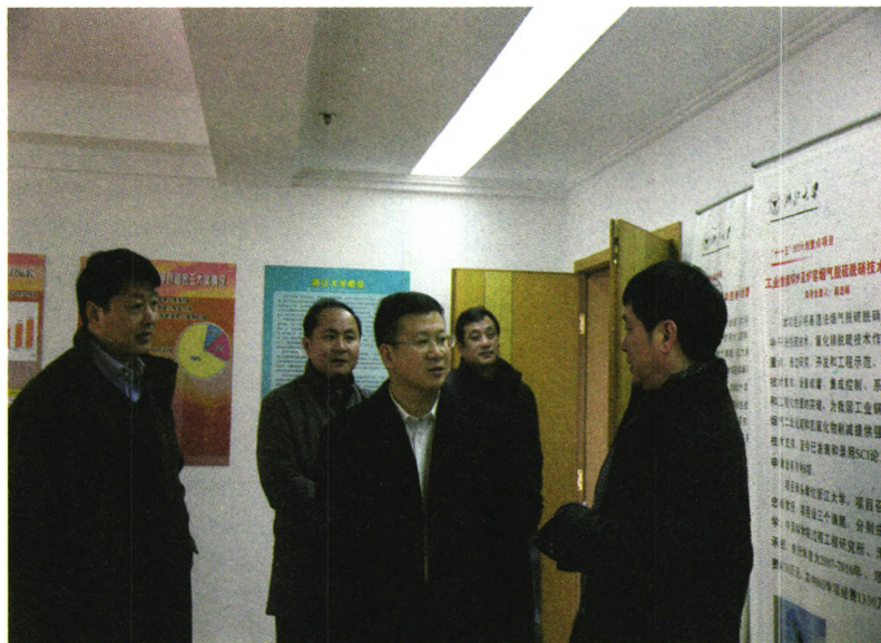
▲ 2月17日,杭州市政府副市长徐文光慰问杭州市科委干部职工和杭州市科技创新服务中心科技工作者。