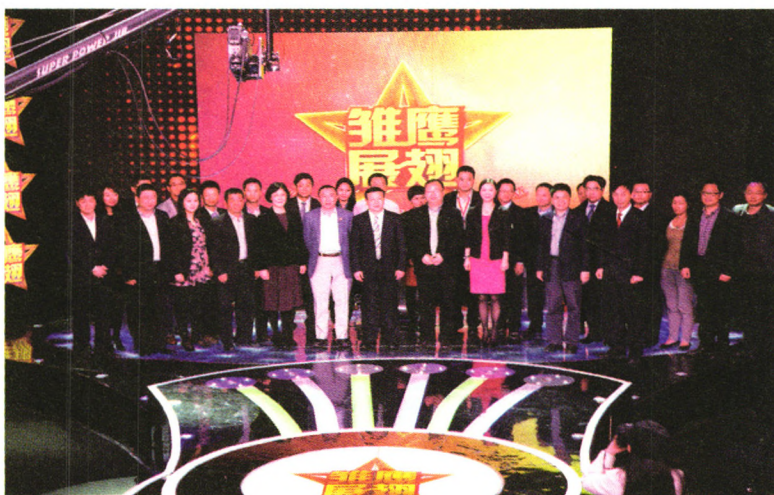
▲ 4月11日,2012年度杭州市“雏鹰杯”最具成长潜力企业评选活动落下帷幕,杭州华润微科技有限公司等20家企业获得了由杭州市科委颁发的500万元创业资助奖金,杭州市副市长徐文光现场为获奖企业颁奖。