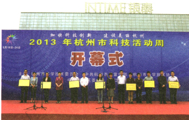
▲ 主席台领导为杭州市产业技术创新战略联盟授牌