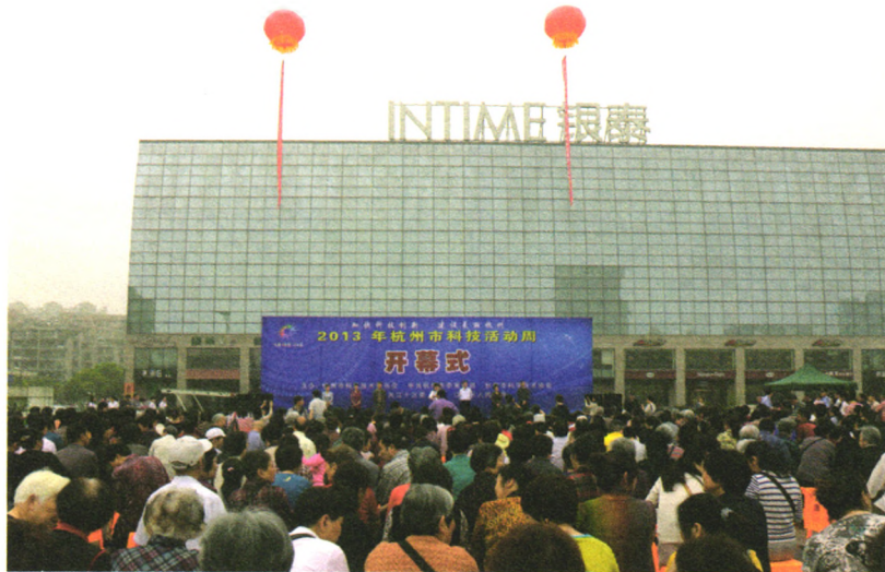
▲ 5月18日,以“加快科技创新,建设美丽杭州”为主题的2013年杭州市科技活动周在庆春广场隆重开幕。