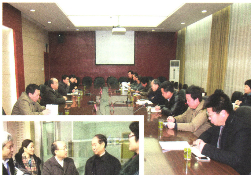
2月17日，浙江省科技厅周国辉厅长一行在杭州调研科技创新工作。