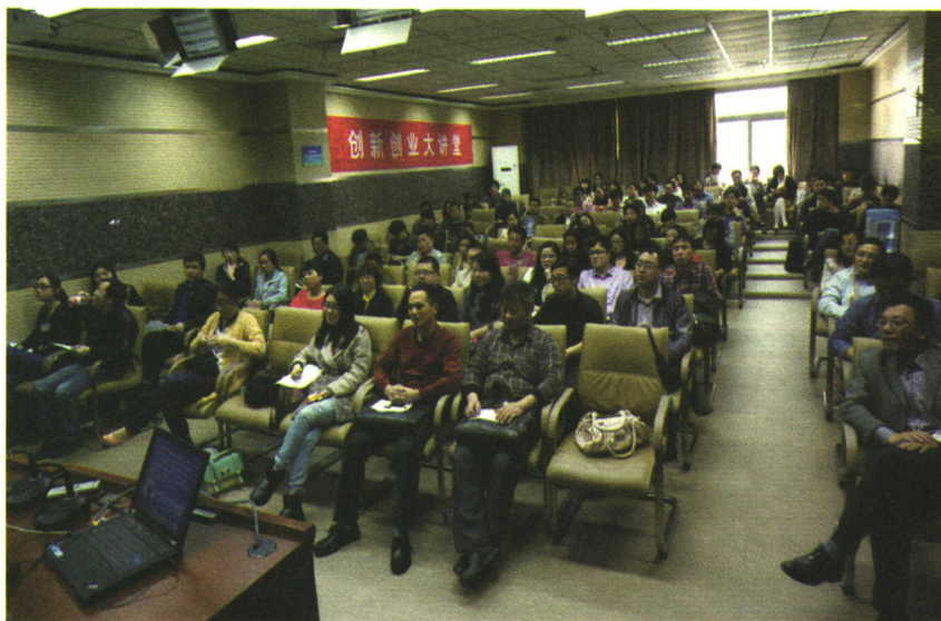
3月26日,由市科委、共青团杭州市委联合举办,市科技创新服务中心、杭州大学生创业联盟共同承办的第三期创新创业大讲堂活动在浙江图书馆文澜厅举行。