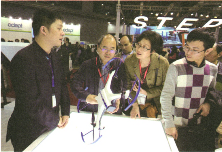
11月4日,杭州市科委党组书记、主任阳作军领队赴上海参观第十七届中国国际工业博览会。