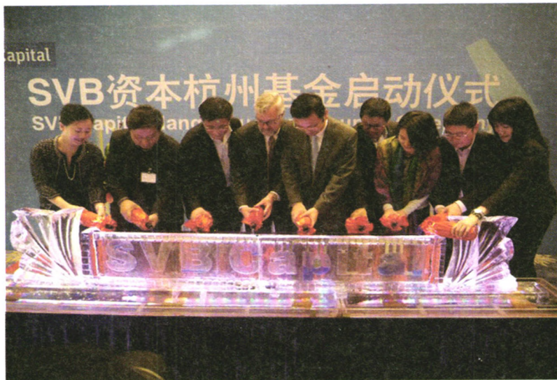
2015年12月16日,杭州市创业投资引导基金牵手硅谷银行资本(SVB Capital)合作设立的杭州基金启动仪式隆重举行,基金旨在重点扶植杭州地区科技型初创企业。

主管单位/ 杭州市科学技术委员会 主办单位/杭州市科技信息研究院 协办单位/杭州科技信息公司 编辑出版/《杭州科技》编辑部