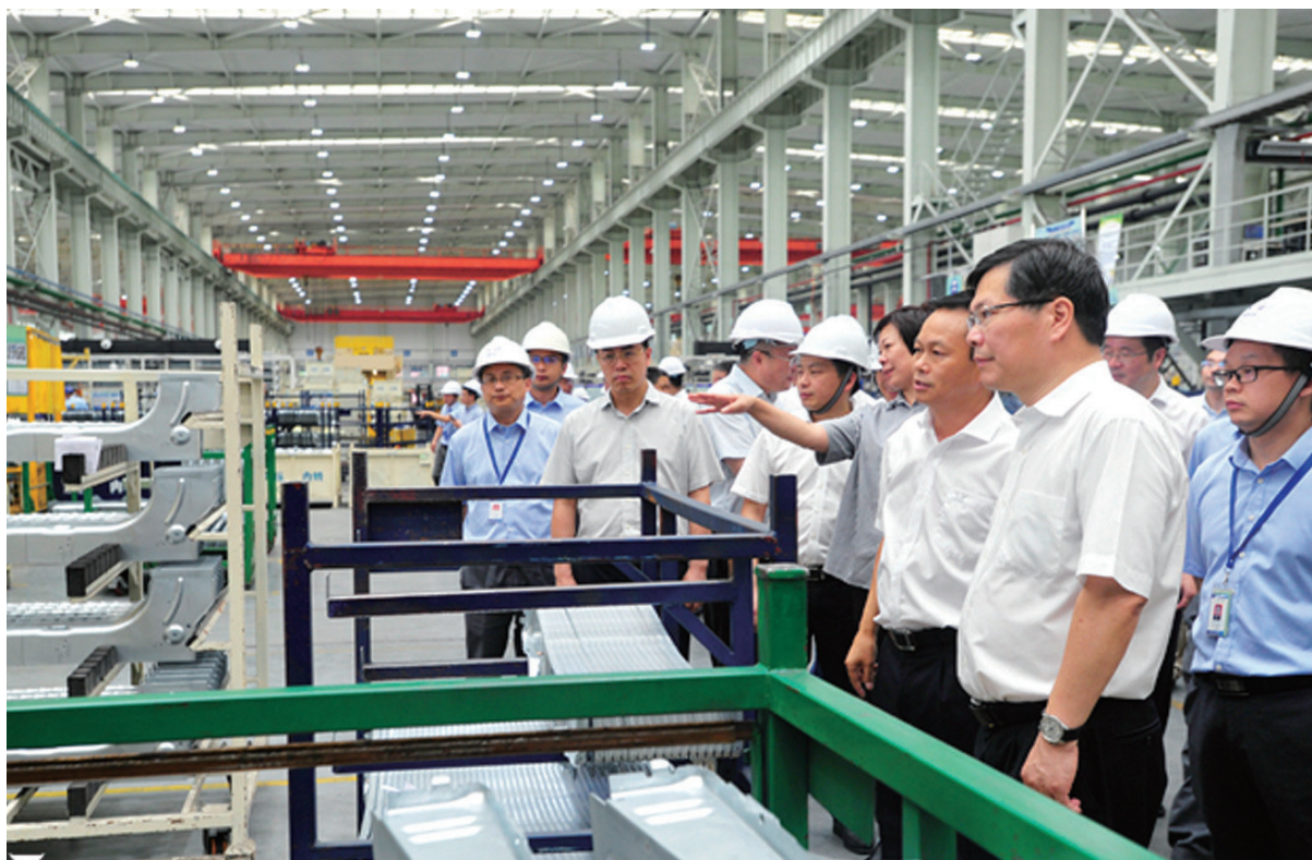
▲ 7月10日,杭州市委副书记、市长徐立毅赴大江东产业集聚区专题调研工业经济。