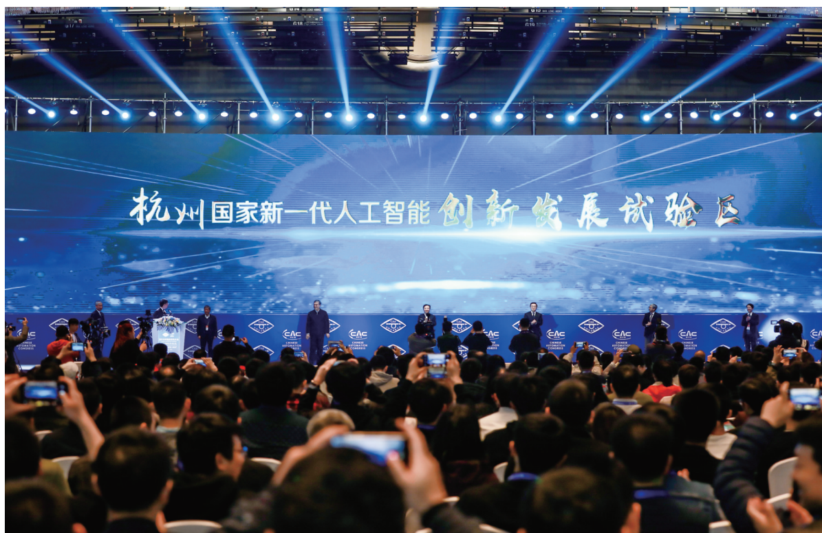
▲ 2019年10月17日,国家科学技术部复函浙江省人民政府,支持杭州市建设国家新一代人工智能创新发展试验区。