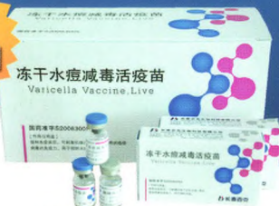
12月龄以上健康儿童均可接种