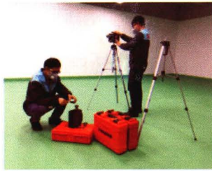
职业卫生检测与评价