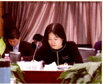
人民卫生出版社王凤丽编辑