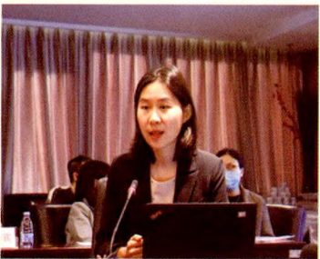
人民卫生出版社李海凌编辑