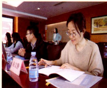
北京大学高文静副教授(右一)