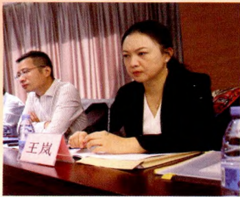
中国疾病预防控制中心王岚研究员