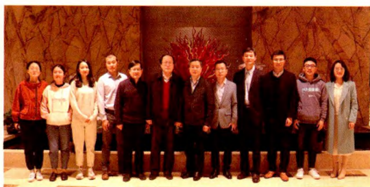
沈洪兵院士(右六)与会务组人员和部分代表合影