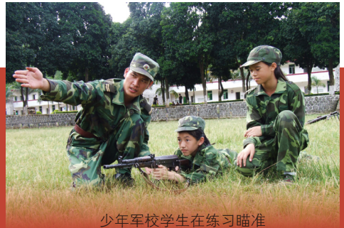
少年军校学生在练习瞄准

广西靖西县实验小学创办于1969年。学校位于县城中心区域，占地面积1万多平方米，建筑面积9170平方米，办学条件日趋完善。学校目前有40个教学班，在校学生2764名，在职教职工112名，其中有特级教师1名，中学高级教师2名，小学高级教师92名。