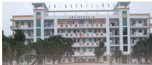
漂亮舒适的教学楼