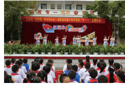
迎“六一”主题大队会