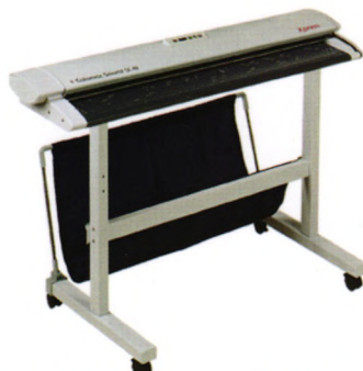
SmartLF SC Xpress系列扫描仪