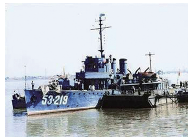
民权号原貌图 (民权号相关历史资料)