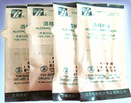
一次性使用酒精棉棒 (10支装)