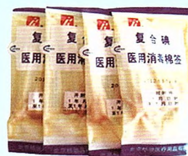
一次性使用复合碘医用消毒棉签 (10支装)