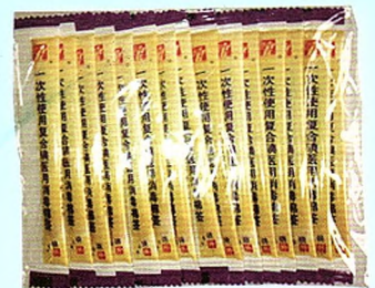
一次性使用复合碘医用消毒棉签 (1支装)