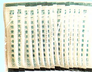
一次性使用酒精棉棒 (1支装)