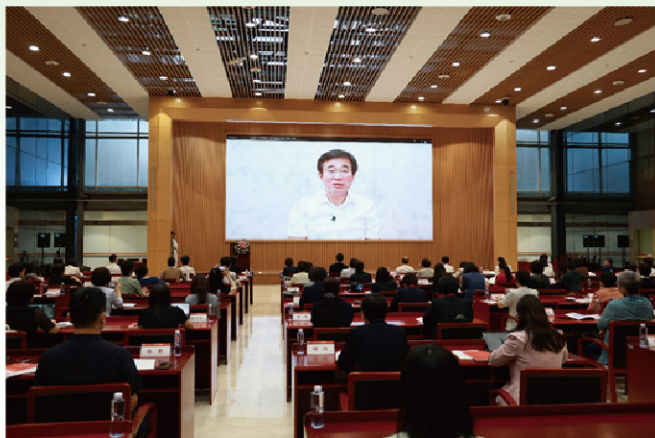
全国科技名词委常委、中国工程院副院长、中国医学科学院北京协和医学院院校长王辰院士致辞

全国科技名词委常委、中国工程院副院长、中国医学科学院北京协和医学院院校长王辰院士专门为成立大会录制了视频致辞，高度评价护理学开启学科名词审定工作，强调了编撰护理学名词的重大意义，并提出建设精美护理学名词体系的要求，体现了对护理学科的高度重视和关心支持。