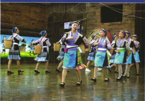
●贵州非遗小花苗捕鱼舞