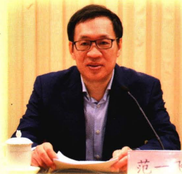
中国人民银行党委委员、副行长 范一飞

2019年3月29日，人民银行召开2019年支付结算工作电视电话会议。会议全面总结了2018年人民银行支付结算工作，深入分析了当前面临的困难与挑战，并就下一阶段重点工作作出全面部署。人民银行党委委员、副行长范一飞出席会议并讲话。