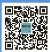
经济动态微信二维码