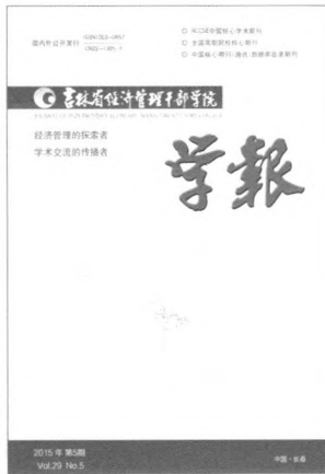
封面题字 许占志 封面设计 秋水