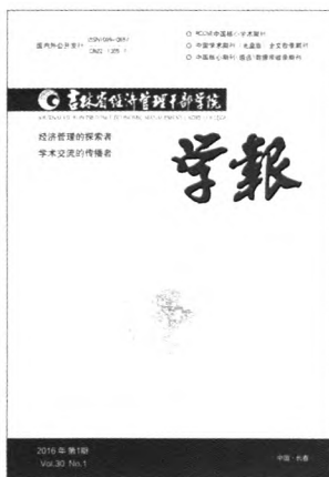
封面题字 许占志 封面设计 秋水