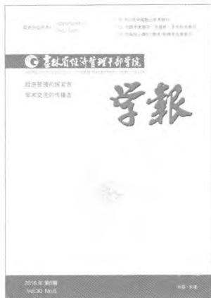
封面题字 许占志 封面设计 秋水