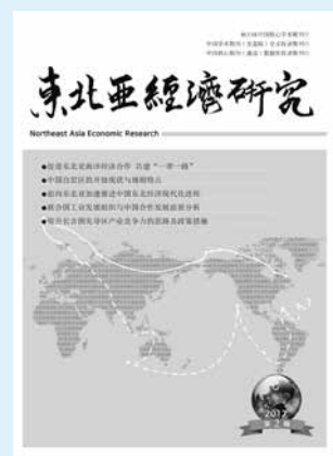
刊名题字 张新兴 封面设计 庄宝仁