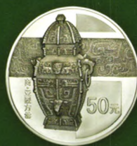
155.52克 (5盎司) 圆形银质纪念币背面图案