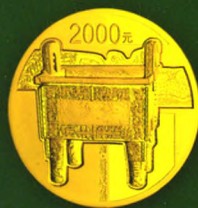
155.52克 (5盎司) 圆形金质纪念币背面图案