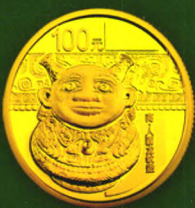
7.776克 (1/4盎司) 圆形金质纪念币背面图案