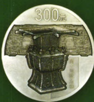
1公斤 圆形银质纪念币背面图案