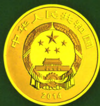
圆形纪念币共同正面图案

中国人民银行于2014年8月发行中国青铜器金银纪念币(第3组)一套 该套纪念币共5枚,其中金币2枚,银币3枚,均为中华人民共和国法定货币