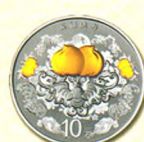
圆形银质纪念币 背面图案(五福拱寿)