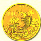
圆形金质纪念币 背面图案(年年有余)