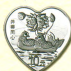
心形银质纪念币 背面图案(井蒂同心)