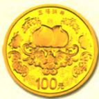
圆形金质纪念币 背面图案(五福拱寿)