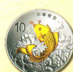
圆形银质纪念币 背面图案(年年有余)