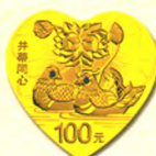
心形金质纪念币 背面图案(井蒂同心)