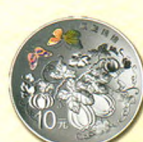
圆形银质纪念币 背面图案(瓜瓞绵绵)