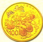
圆形金质纪念币 背面图案(瓜瓞绵绵)