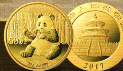
图片仅供参考，产品以实物为准

中国金币总公司 总经销 Solely distributed by China Gold Coin Incorporation