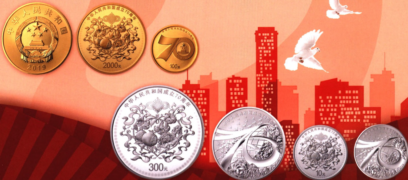
图片仅供参考 请以实物为准

The 70th Anniversary of the Founding of the People's Republic of China Gold and Silver Commemorative Coins