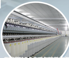
赐来福A8全自动气流纺纱机 Schlafhorst A8 Rotor Spinning Machine