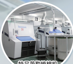
特吕茨勒梳棉机 Truetzschler carding engine