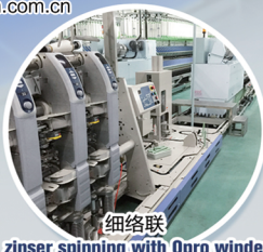
细络联 zinser spinning with Qpro winder