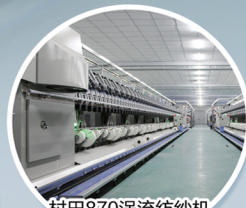
村田870涡流纺纱机 Murata Vortex 870 Spinner