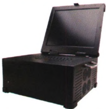
CPCI总线上翻式便携机