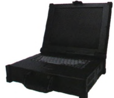
便携式实时仿真测试设备