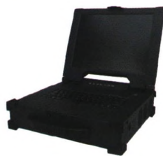
兼顾FC航电总线的小型化通用平台