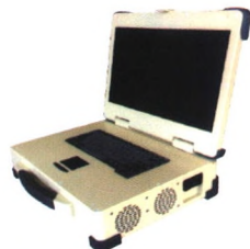
COMe架构小型化通用平台