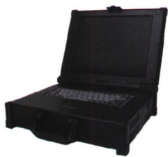
ETX架构小型化通用平台