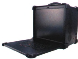
CPCI/PXIe总线下翻式便携机