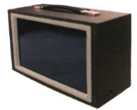
CPCI总线加固式便携机