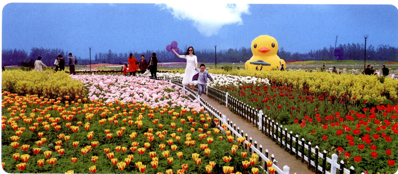
温馨花海