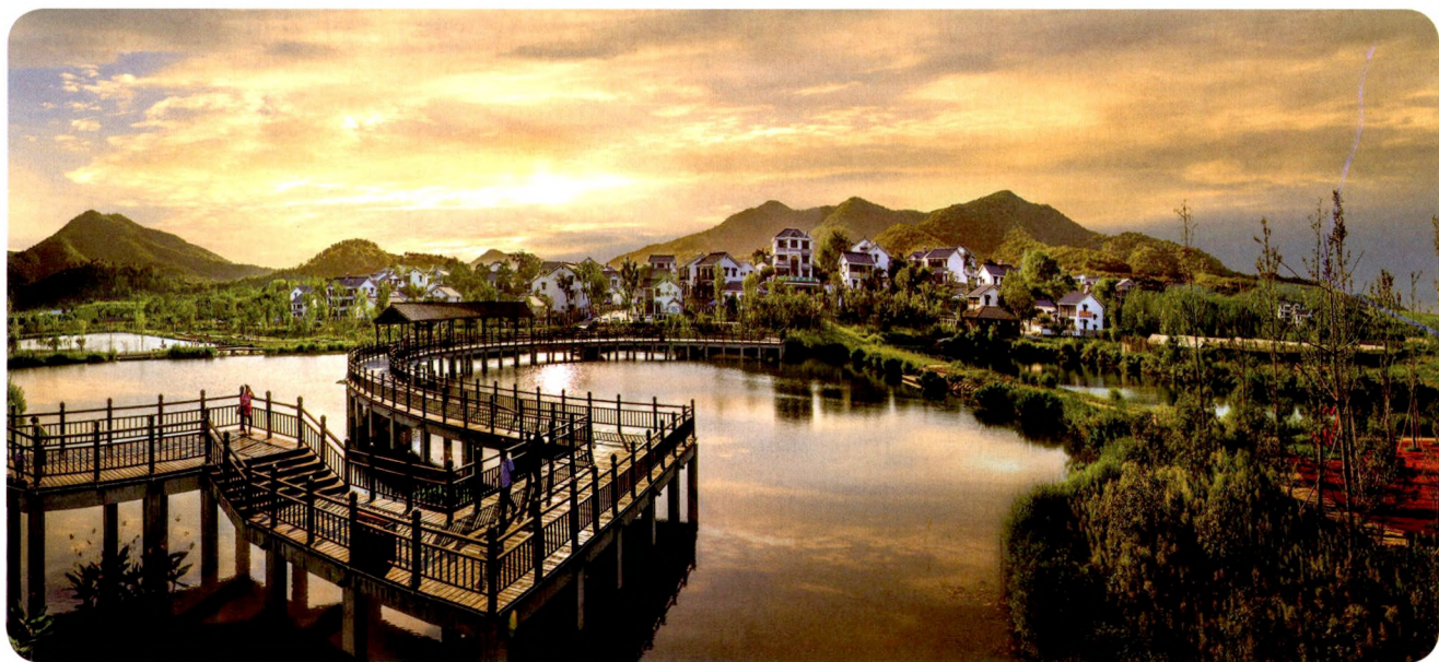
南京江宁石塘人家