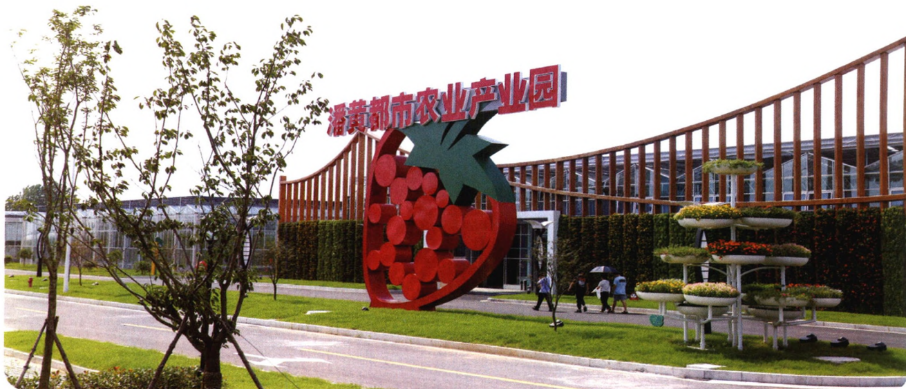
盐都区潘黄都市农业产业园