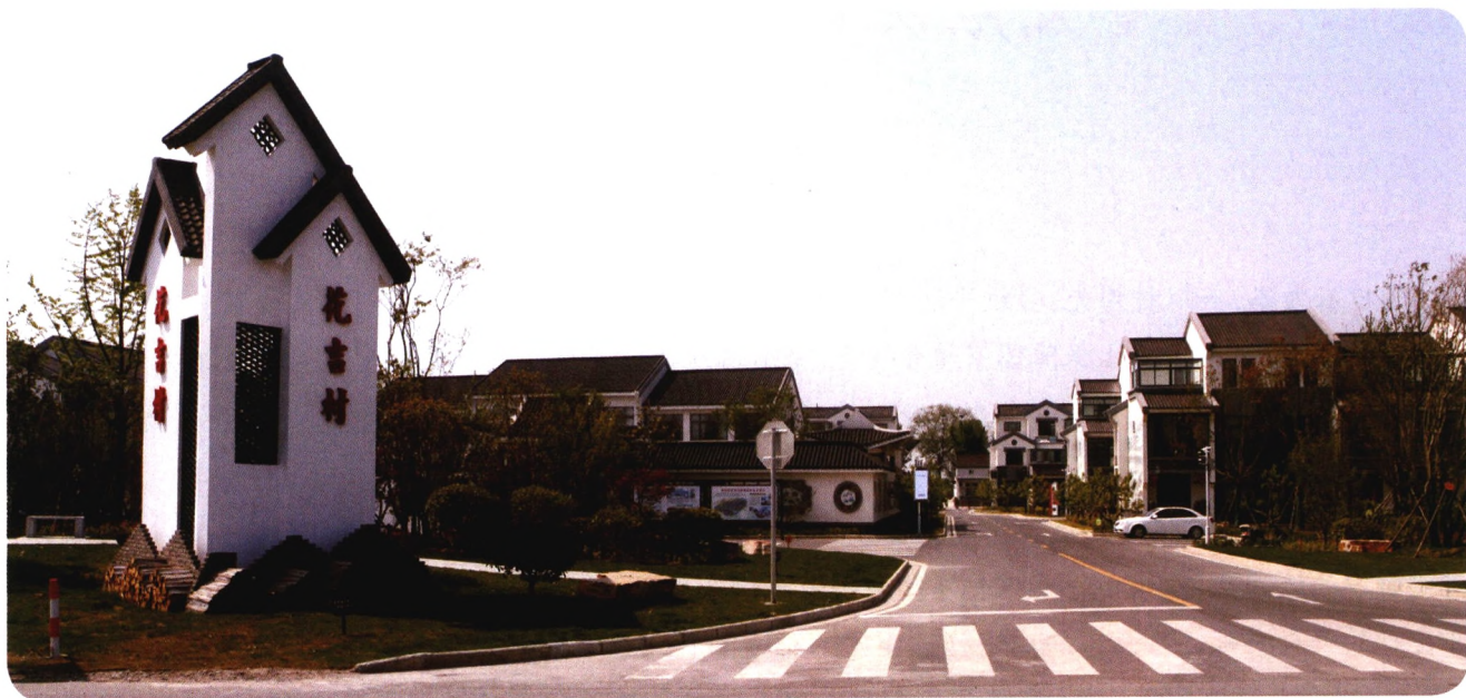
盐城市盐都区盐渎街道花吉村新型农村社区