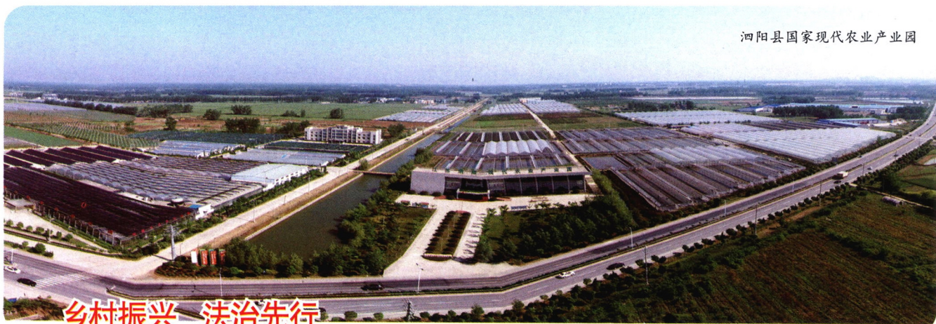
泗阳县国家现代农业产业园

乡村振兴促进法正式施行,这是三农领域的一部大法,也是全面推进乡村振兴的一件大事。各级农业农村部门要深入学习领会,扎实推进法律全面落实,为全面推进乡村振兴、加快农业农村现代化提供强有力的法治保障。