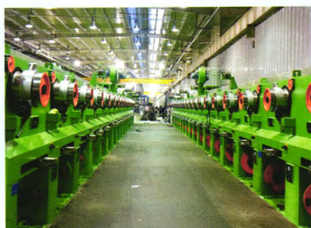
SS770A双卷筒镀黄铜收线机

地址：江苏省江阴市周庄镇长寿长宁路18号 邮编：214424 电话：0510-86966968/86368168 传真：0510-86966968 网址：www.chinahuafang.com.cn 邮箱：huafangjs@sina.com/trade@chinahuafang.com.cn