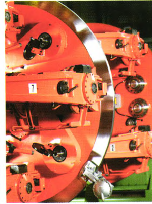
行星式捻股合绳机