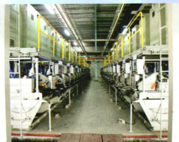
双联智能型水箱拉丝机