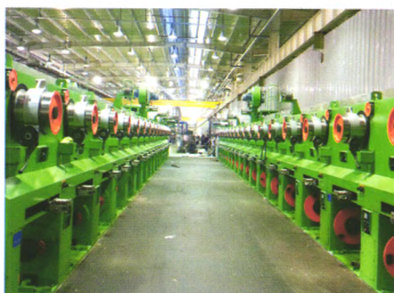
SS770A双卷筒镀黄铜收线机

地址：江苏省江阴市周庄镇长寿长宁路18号 邮编：214424 电话：0510-86966968/86368168 传真：0510-86966968 网址：www.chinahuafang.com.cn 邮箱：huafangjs@sina.com/trade@chinahuafang.com.cn