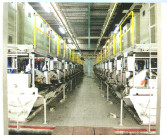
双联智能型水箱拉丝机