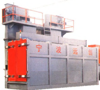
FC-SCBM4800单旋臂线材专用清理机