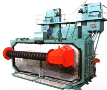
FARC-3800型线材抛丸专用清理机