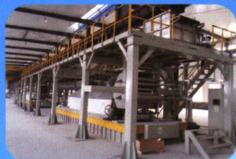
无酸洗热镀锌/锌铝钢丝生产线