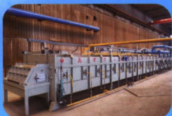
燃气明火加热钢丝热处理炉