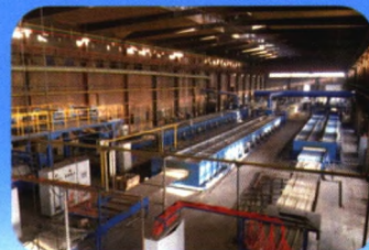
还原法热镀锌/Galfan钢丝生产线