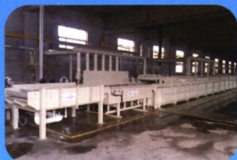
高速热镀锌钢丝生产线Dv150