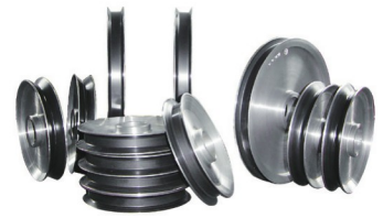
铝合金导轮 (表面喷涂陶瓷)