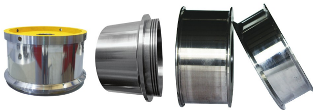
各种规格拉丝卷筒、牵引轮 (表面喷涂碳化钨、堆焊、合金锻打热处理等工艺)