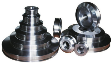
水箱拉丝塔轮 (表面喷涂碳化钨或全合金真空处理)