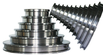
金刚线母线拉丝塔轮 (表面喷涂碳化钨或全合金真空处理)