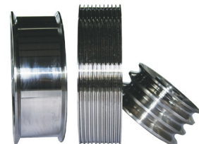
过线导轮 (表面喷涂碳化钨或全合金真空处理)

本公司是中国热喷涂协会常务理事单位，专业从事超硬耐磨制品的生产加工。所生产产品主要适用于各种钢丝（包括高中低碳钢丝、合金钢丝、不锈钢丝，焊丝等）及其他线材加工过程中的卷筒、导线轮和拉丝塔轮。采用表面喷涂碳化钨和全合金材料真空处理两种生产工艺，接受定制。